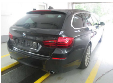
zadná časť vozidla