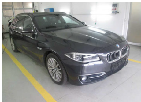
pravá strana vozidla