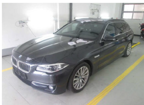
predná časť vozidla