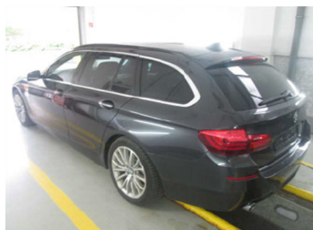
ľavá strana vozidla